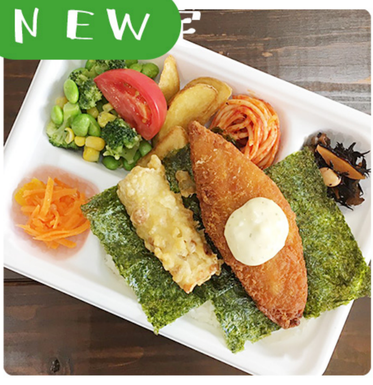
NEW 今も昔も変わらぬ味 のり弁当 (にちらプラ容器です★) 580円(税別)