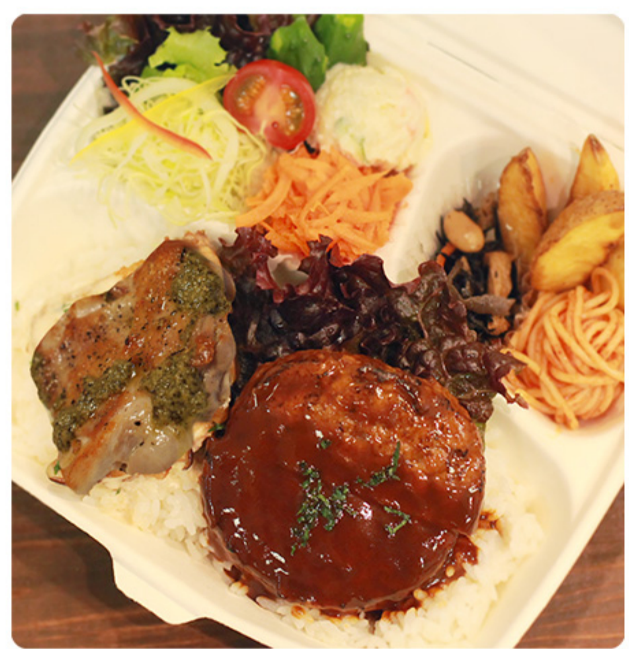
森の恵みのグリルチキン ＆ハンバーグ弁当 860円(税別)