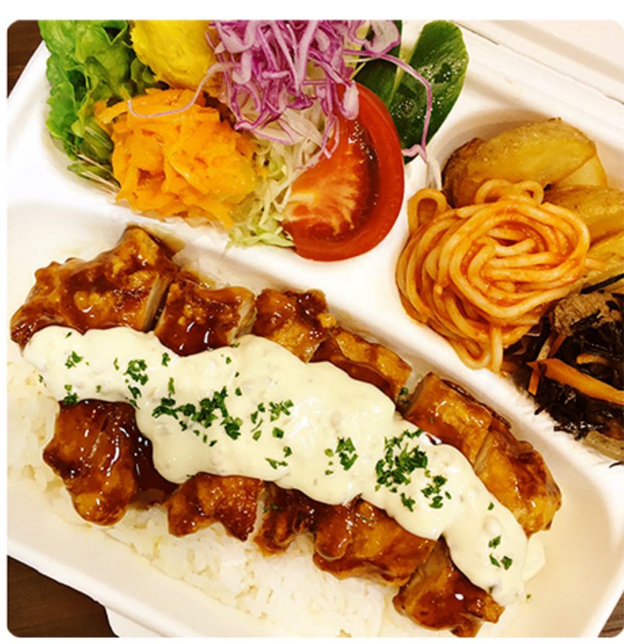
ボリューム満点!! チキンたるたるとん 780円(税別)