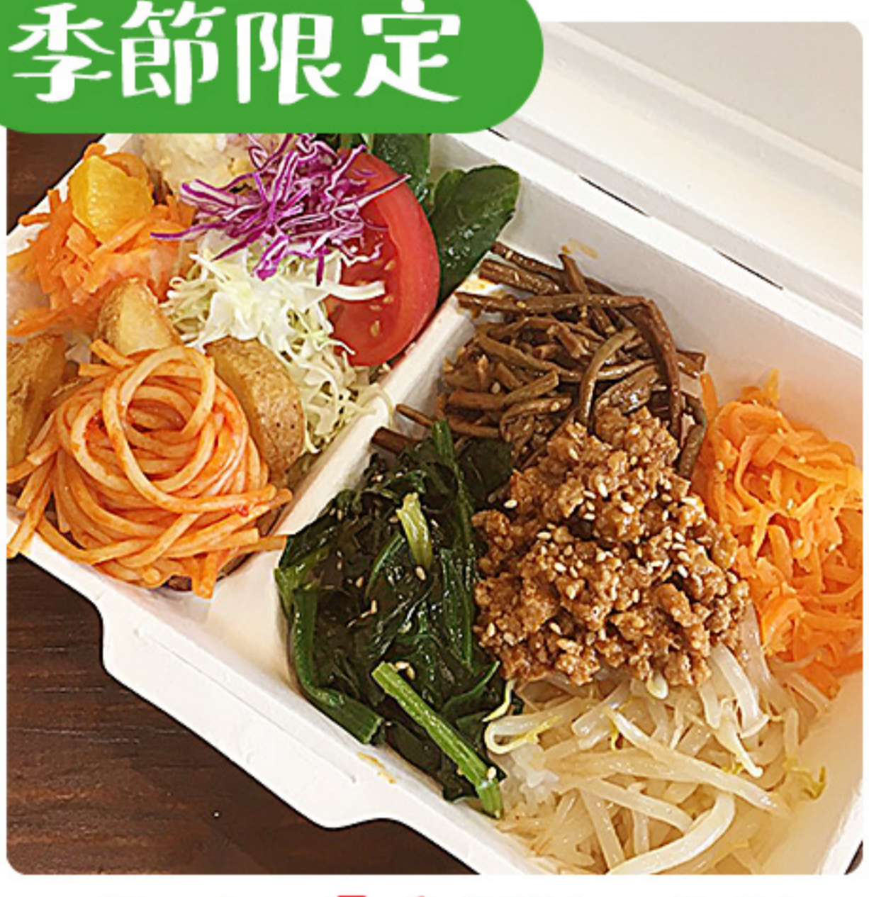
季節限定 人気のため夏季も続行します! ピリ辛 特製ビビンバ弁当 680円(税別)