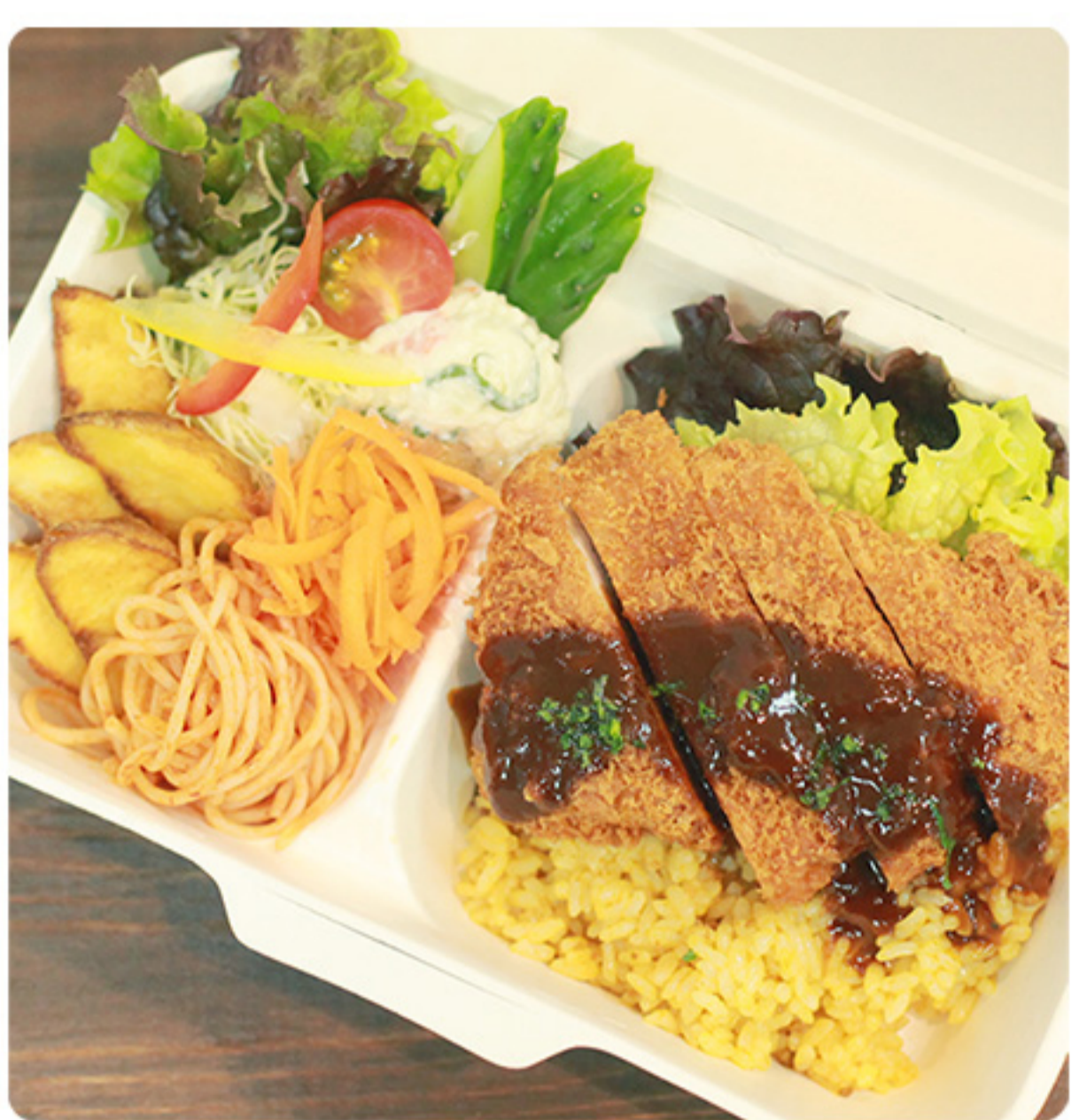
食べごたえ満点!! 三元豚のトルコライス 760円(税別)