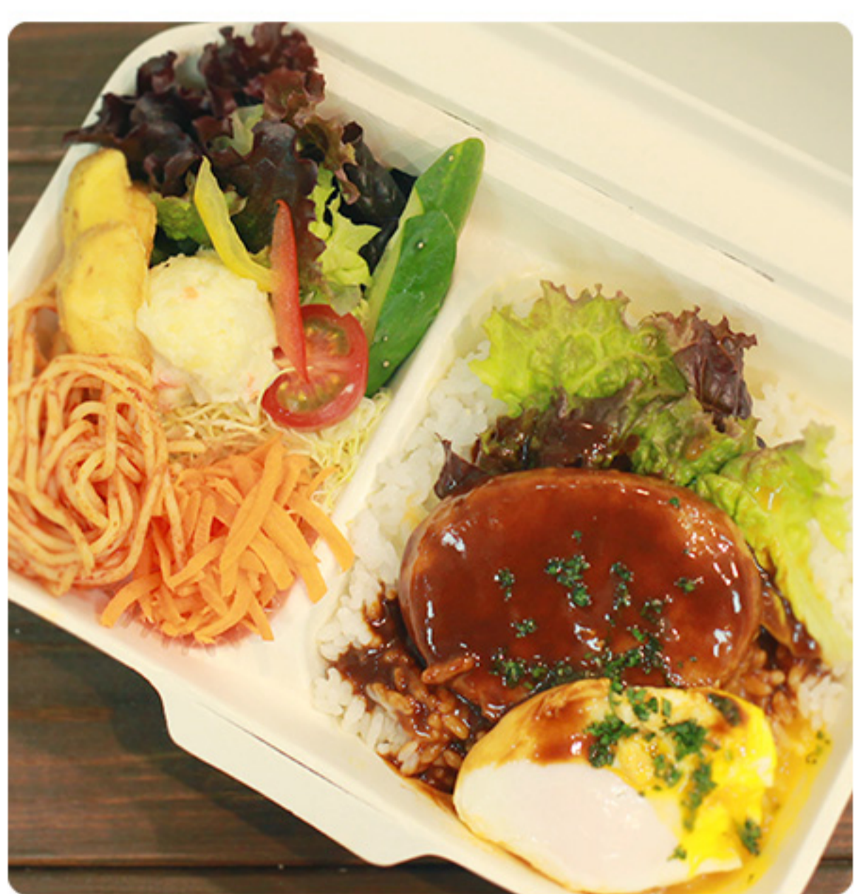
温泉卵の ロコモコ弁当 680円(税別)