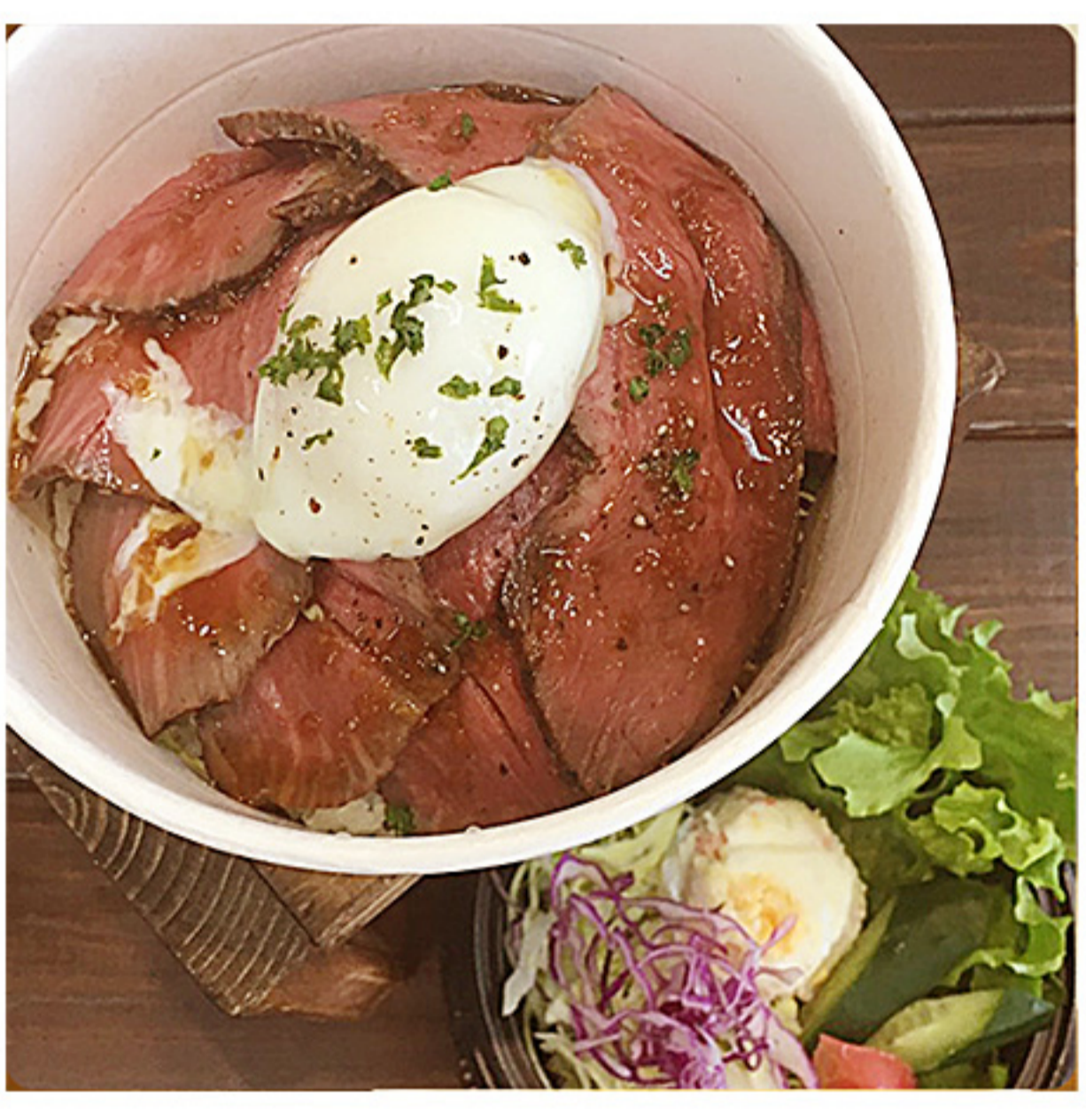
うまみたっぷり ローストビーフ丼 (サラダ付き) 1180円(税別)