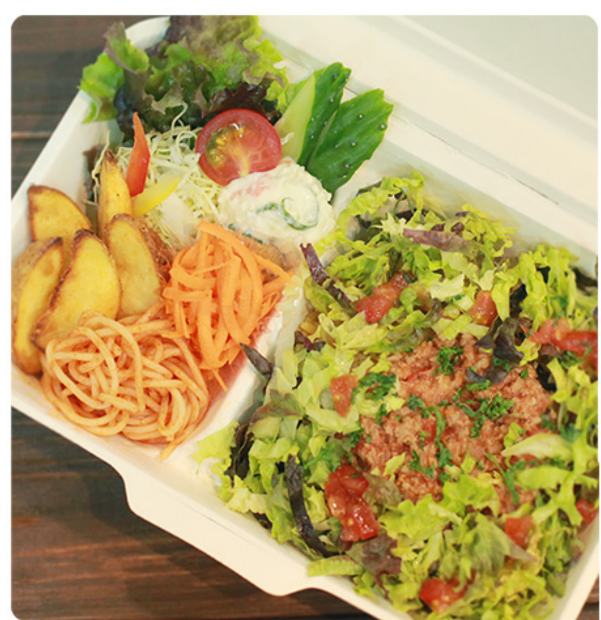
「沖縄ソウルフード」しゃきしゃき れたすのタコライス 640円(税別)