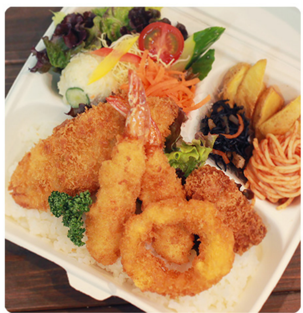
海の恵みの ミックスフライ弁当 890円(税別)