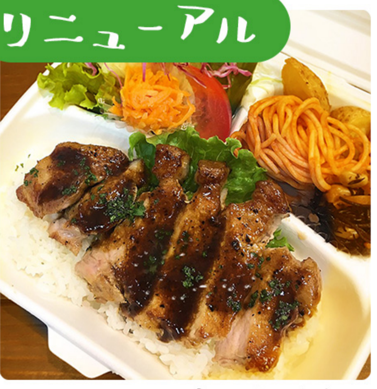
リニューアル チャーシューとん 沖縄県産茶美豚 トンテキ弁当 豚肉が茶美豚に変更になりました! 860円(税別)