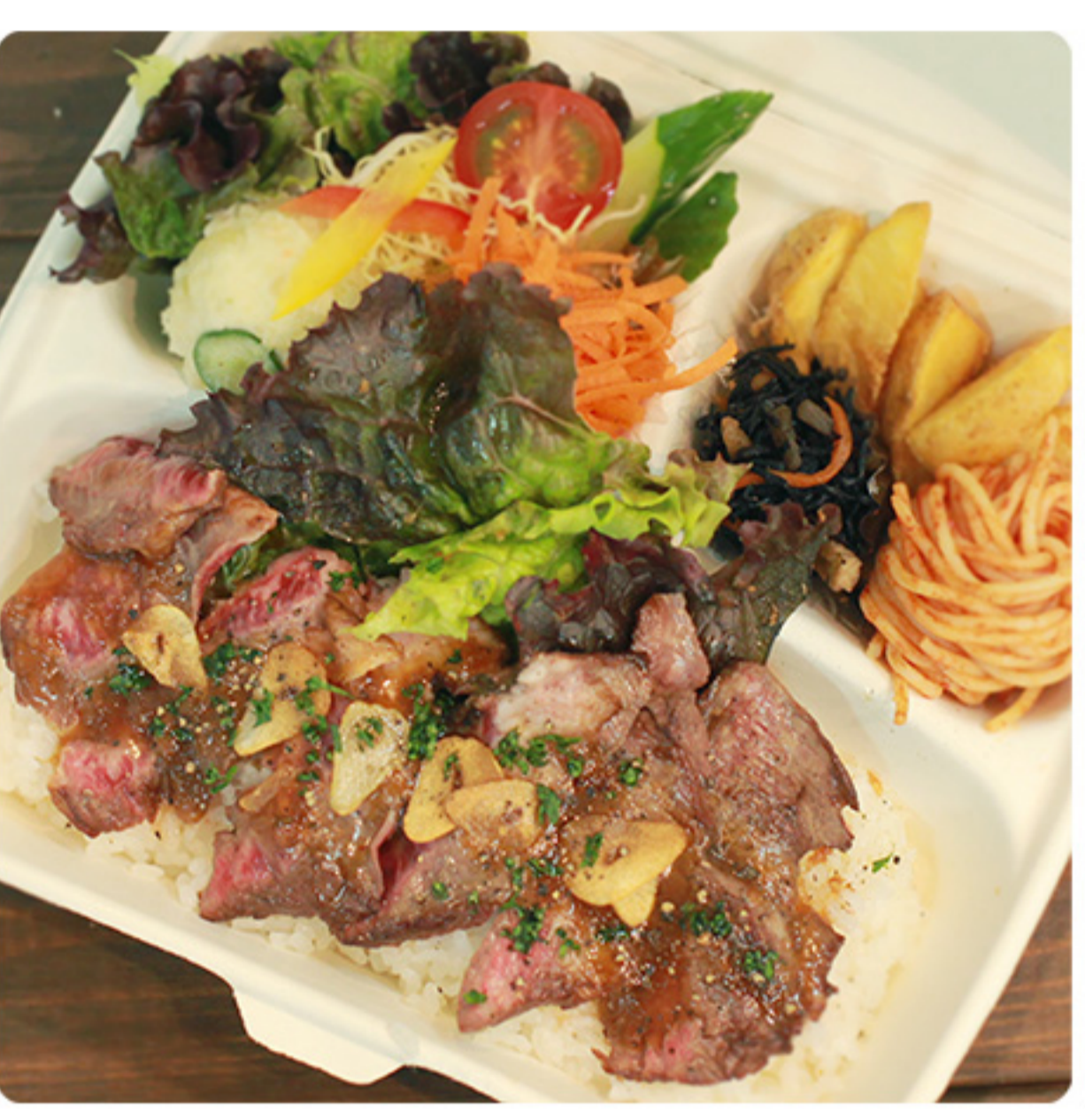
絶品!ステーキ＆ ガーリックライス弁当 1080円(税別)