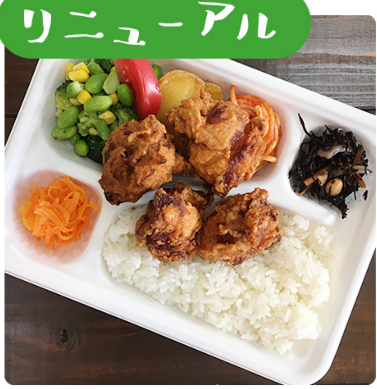
めぐみ特製 トリのからあげ弁当 (プラ容器に変更になりました★) 580円(税別)