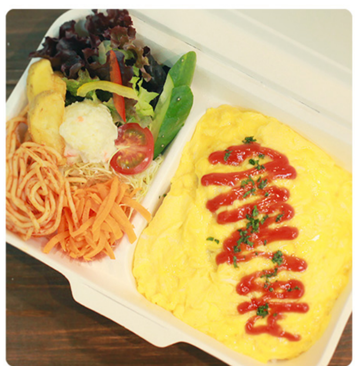
ふわとろ卵の オムライス弁当 680円(税別)