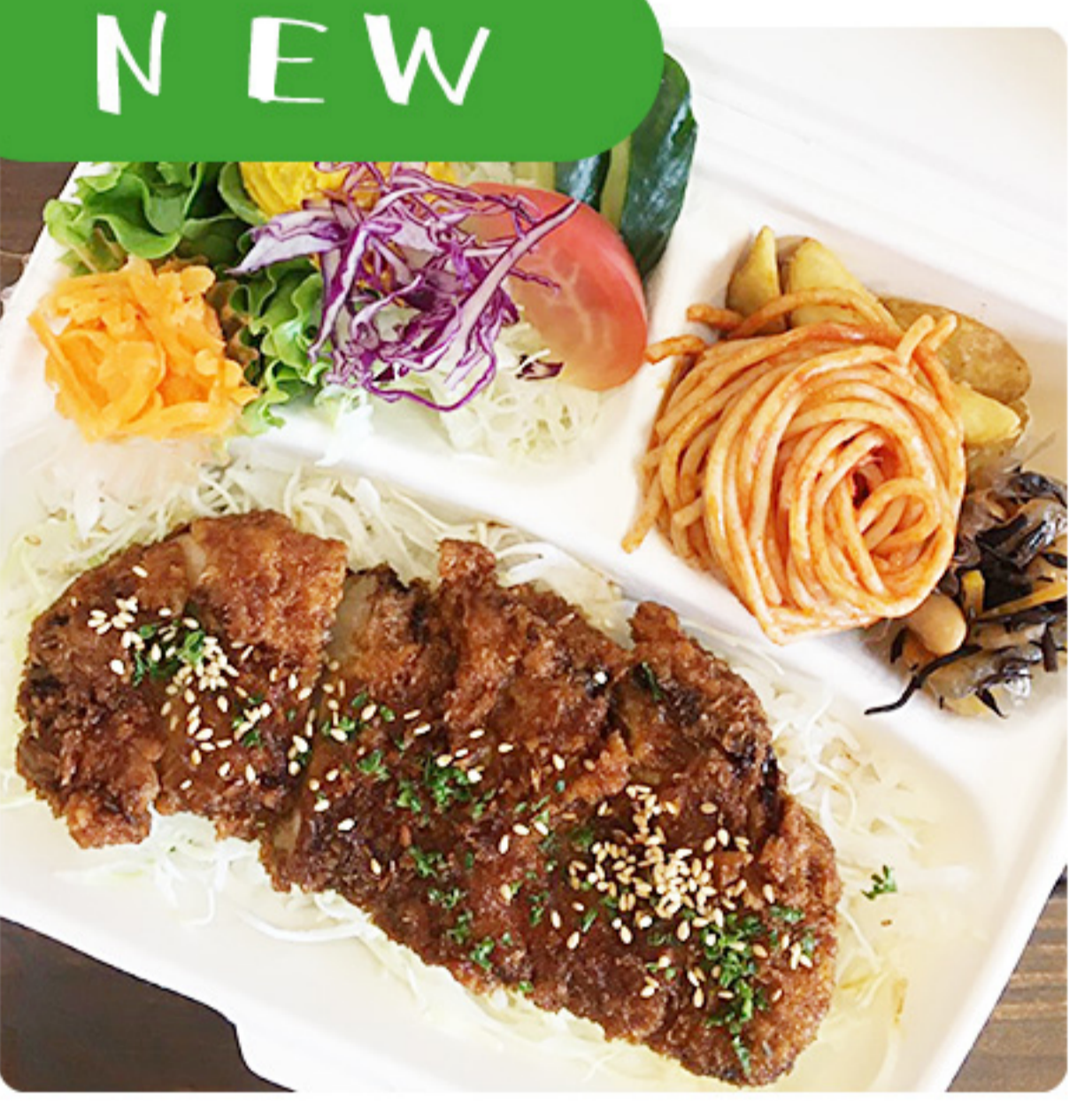
NEW サクッジュワッ! チャーシューとん 沖縄県産茶美豚ロースの ソースカツ弁当 860円(税別)