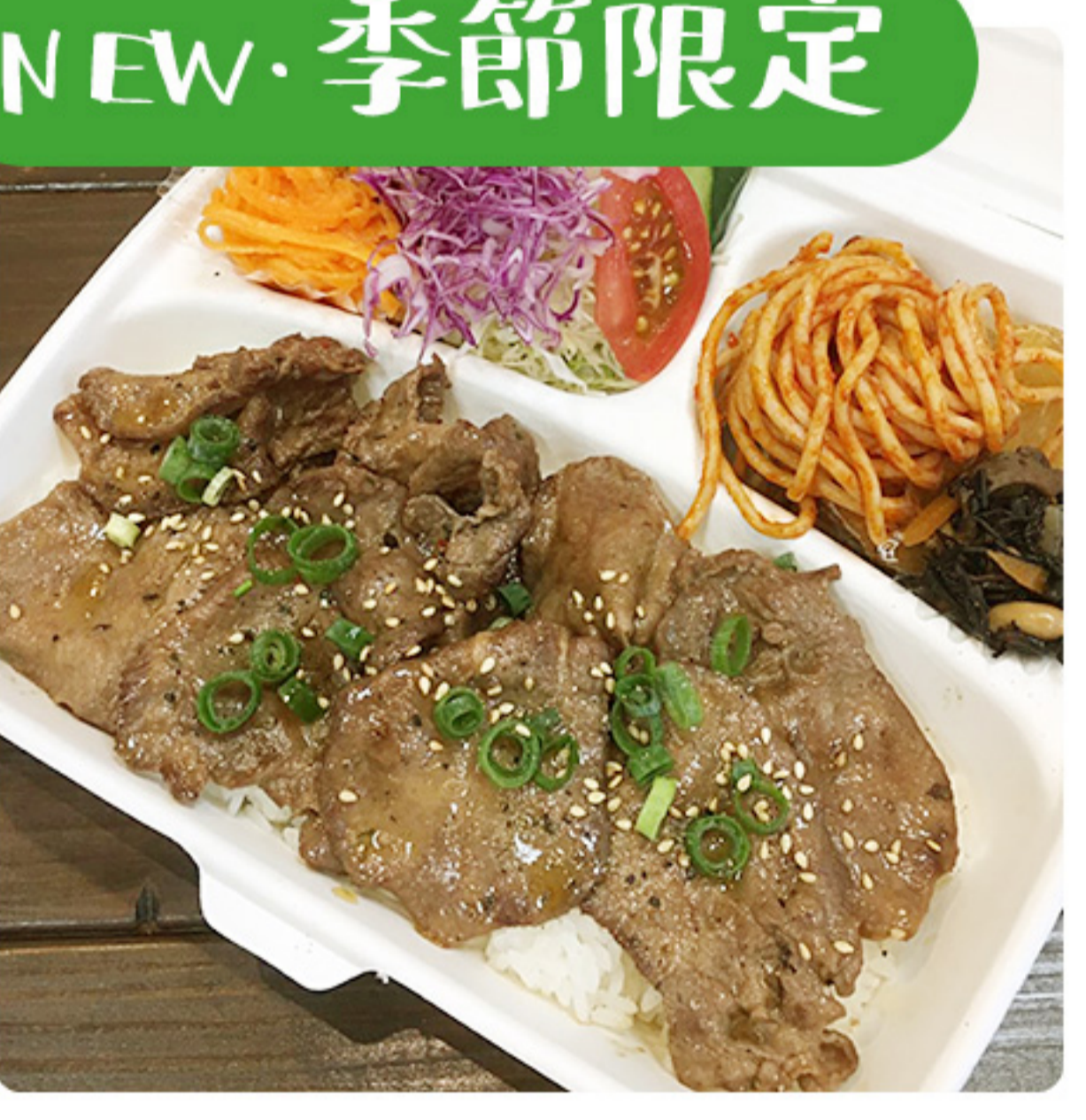
NEW・季節限定 夏の食欲そそる!!! 特製タン塩れもん弁当 1080円(税別)