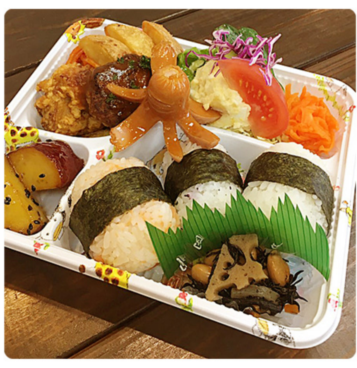
からあげハンバーグ めぐみのお子様弁当 (※副菜は変動します) 500円(税別)